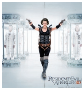
Resident Evil : L'au-delà 3D ( Resident Evil: Afterlife 3D )

Les productions étrangères tournées en Ontario en 2009 incluaient les œuvres suivantes : Scott Pilgrim vs. le monde ( Scott Pilgrim vs. The World ), une comédie d'Universal Studios tournée à Toronto avec comme tête d'affiche Michael Cera (lui-même originaire de Brampton); et Entrepôt 13 ( Warehouse 13 ), la nouvelle série télévisée de NBC/Universal.