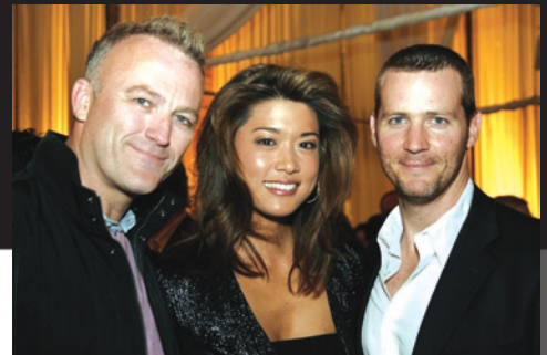
Les vedettes de la série de télévision The Border James McGowan, Grace Park et Graham Abbey à Fêtons l'Ontario

Fêtons l'Ontario, l'événement que nous organisons chaque année pour rendre hommage aux films et aux cinéastes du Festival international du film de Toronto, a eu lieu le 11 septembre et a réuni près de 600 personnalités éminentes de l'industrie cinématographique, du gouvernement et des médias.