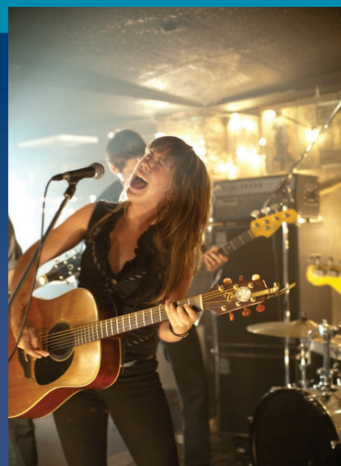
Serena Ryder sur City Sonic . Pour en savoir plus, rendez-vous à l'adresse http://www.citysonic.tv/