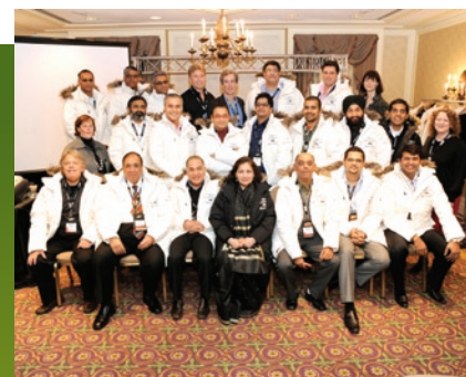
Délégation de l'Inde, Canadian Music Week 2010

Financé par l'intermédiaire du Fonds de partenariats pour le secteur du divertissement et de la création, le programme a permis à 25 acteurs clés du secteur indien de la musique et de la radiodiffusion de nouer des relations d'affaires avec des sociétés ontariennes.