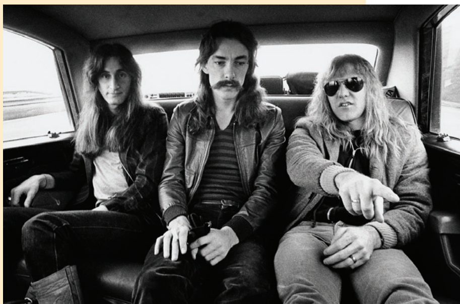
Rush: Beyond The Lighted Stage