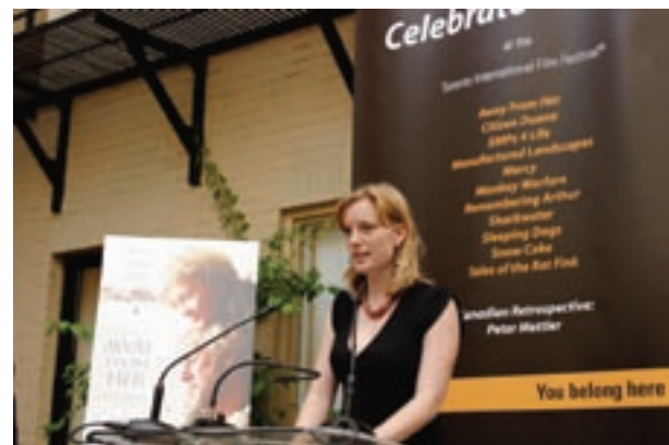
La cinéaste Sarah Polley mentionne que le Fonds de la SODIMO pour la production cinématographique lui a permis de tourner son premier long métrage Away From Her en Ontario, lors de la soirée Celebrate Ontario organisée par la SODIMO lors du TIFF®